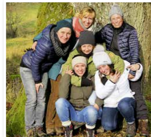
Zusammenhalt Die Kolleginnen aus der Yoga-Ausbildung sind ein dankbares Test-Publikum fürs Kabarett-Programm